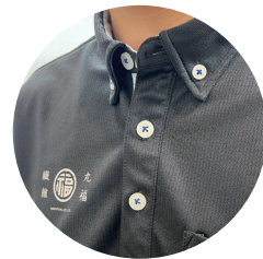
ジーベック 6180 ボタンダウン半袖ポロシャツ ブラック